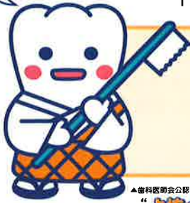
▲歯科医師会公認ゆるキャラ 「ぶ坊さん」

今年の公開講座は、イベント"歯-トフル淡海2016"と併会します。トークショーや歯みがき指導コーナー、お口の機能チェックゲームコーナーも設けていますので、皆様奮ってご参加下さい!